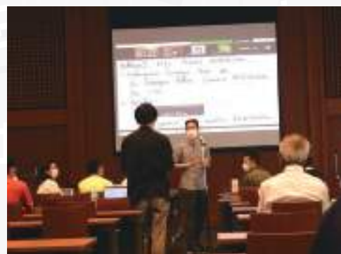
スタディグループの様子

社会や産業におけるさまざまな現実的問題に対して、数学研究者が協働で取り組む産学連携シーズ発掘に極めて有効な短期集中の問題解決型研究合宿です。プログラム担当者と全学年の学生に加え、企業や異分野の研究者、および学部生や他大学からの参加も得て年に1回程度実施しています。