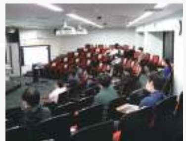
マス・フォア・イノベーション・カフェの風景